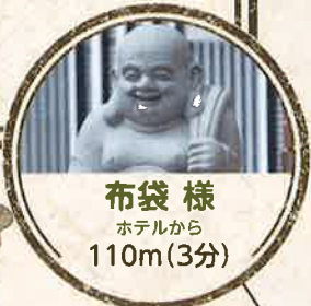
布袋様 ホテルから 110m(3分)