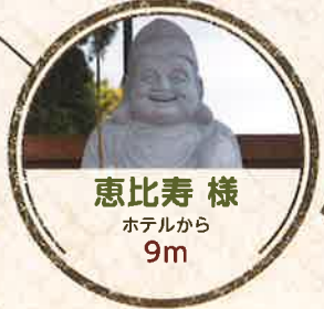
恵比寿様 ホテルから 9m