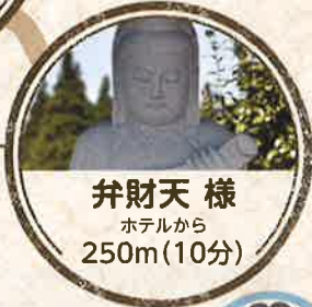
弁財天様 ホテルから 250m(10分)