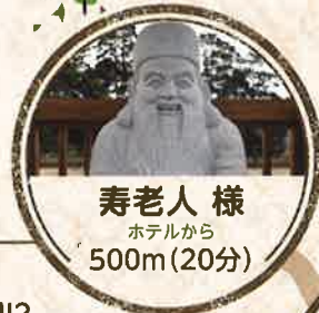
寿老人様 ホテルから 500m(20分)