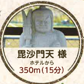
毘沙門天様 ホテルから 350m(15分)