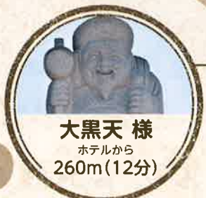
大黒天様 ホテルから 260m(12分)