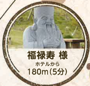
福祿寿様 ホテルから 180m(5分)