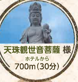
天珠観世音菩薩様 ホテルから 700m(30分)